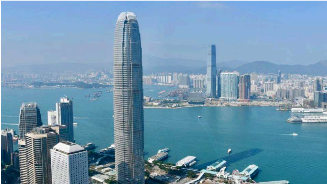
香港必須維護香港國際金融中心的地位。資料圖片